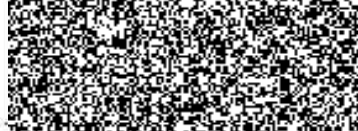
razítko a podpis Olga Adámková