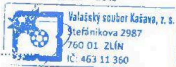
Bc. Petr Zbranek