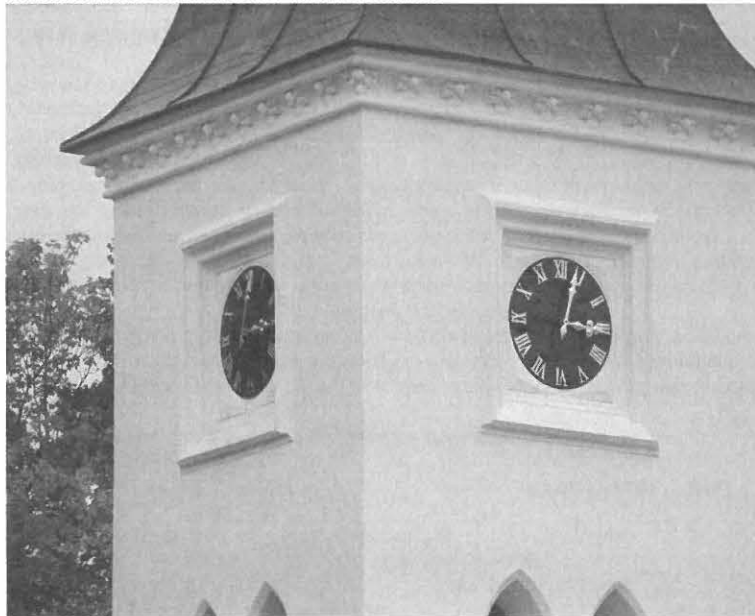
Ukázka nového číselníku kostel Vacov Prachatice

Celkem bez DPH 30.160,- DPH 21 % 6.333,60 Cena celkem 36.493,60