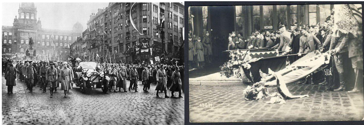
Ilustrační fotografie příjezd T.G.M., vztyčení praporů

Tento scénář se bude opakovat jak v sobotu, tak v neděli s možností drobné úpravy podle aktuálních požadavků Zadavatele.