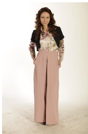
Ilustrační foto historických kostýmu