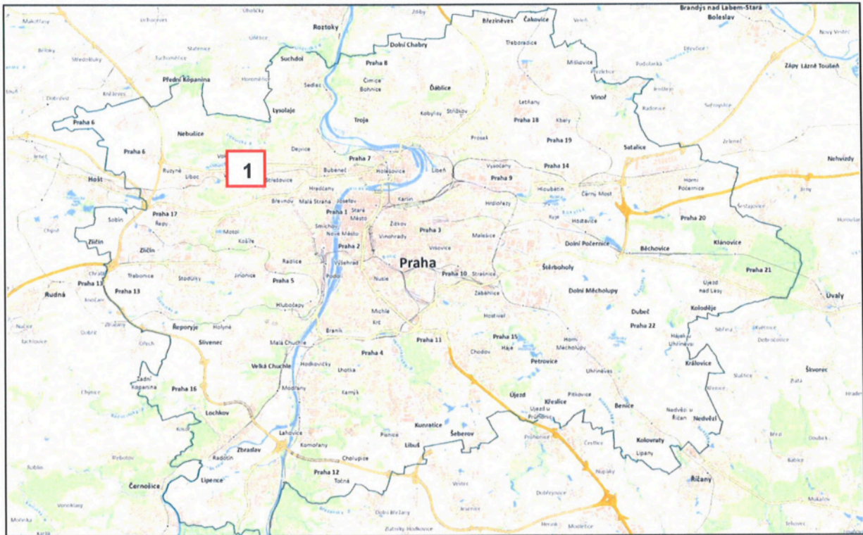
Obr. 1 Lokalita v Praze