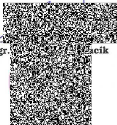
Mgr. .... acík