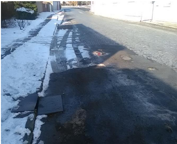
Most ev. č. 2371-1