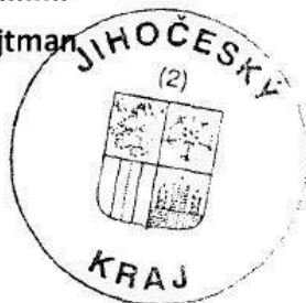
Mgr. Jiří Zimola, hejtmán Jihočeský kraj