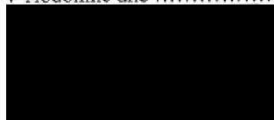
Mgr. Milan Lúčka starosta města