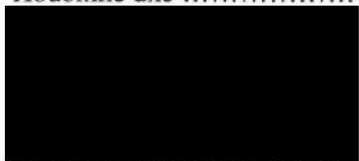
Mgr. Milan Lúčka starosta města