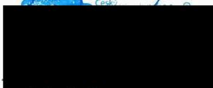
Zhotovitel: Ondřej Kokeš, místopředseda představenstva