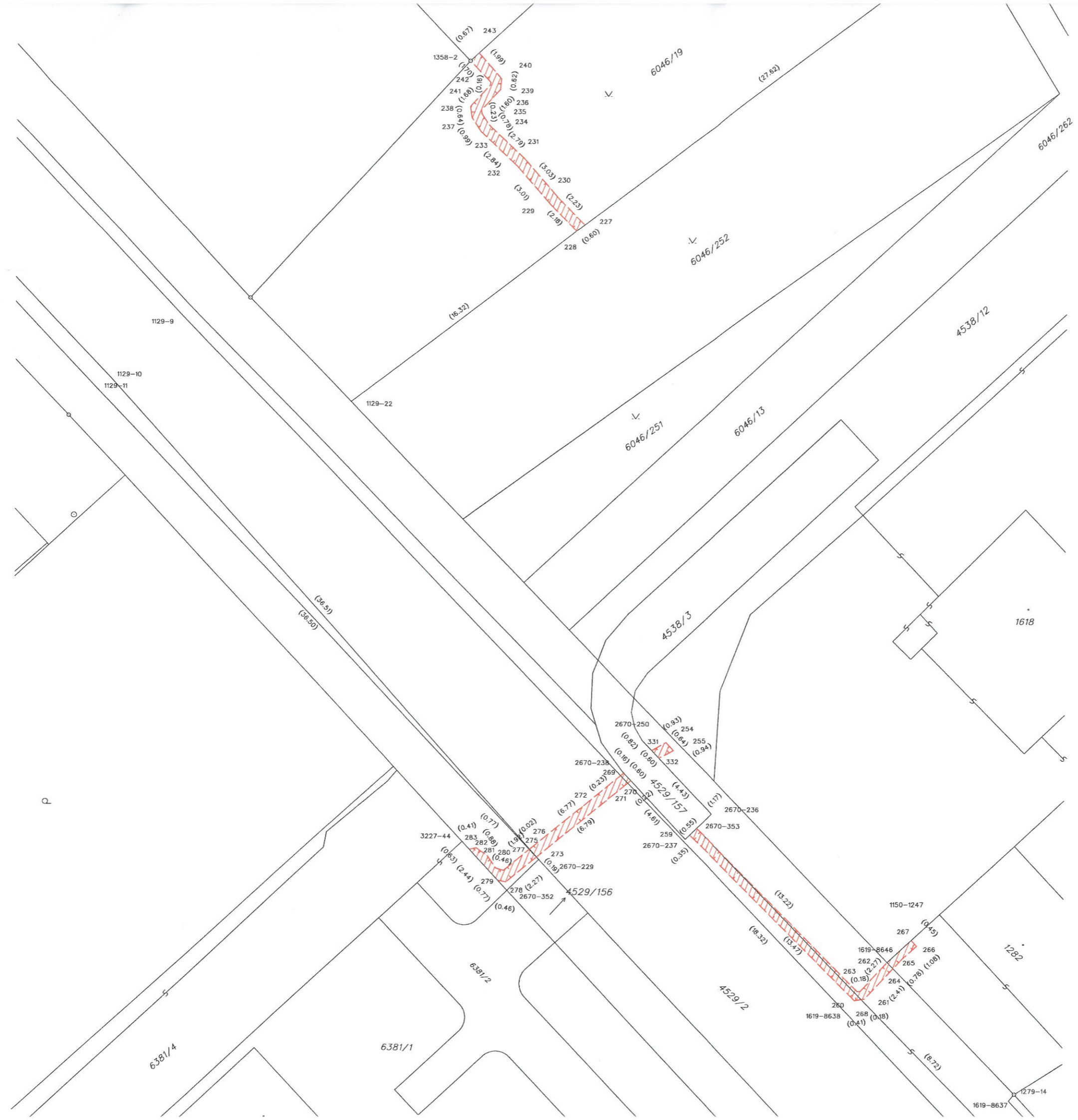
Seznam souřadnic (S-JTSK) Číslo bodu Souřadnice pro zápis do KN Y X Kód kv. Poznámka