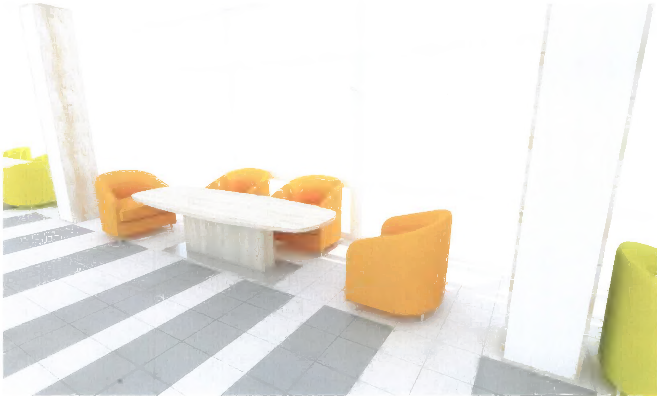
příloha kupní smlouvy "Designový návrh Prodávajícího"