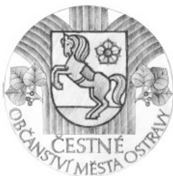
lící strana AVERZ průměr 100mm pozlaceno/tombak