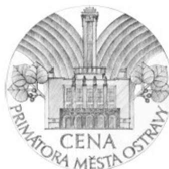
rubová strana REVERZ průměr 100mm postřibřeno/tombak