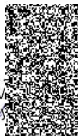
Mgr. Ing. M. Šek ekonomický zástupce

FRANKOSPOL OFFICE s.r.o. Svazarmovská 309 738 01 Frýdek-Místek tel: 555 531 600, fax: 555 531 610 IČ: 252 22 2222 DIČ: CZ25910027