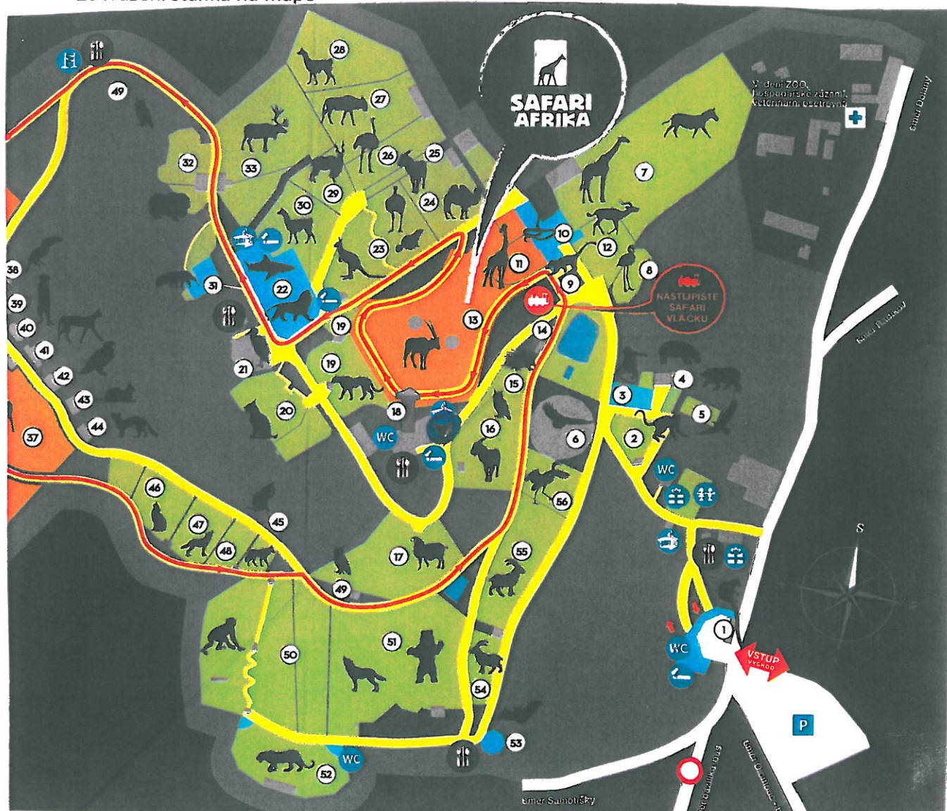
Příloha č. 2