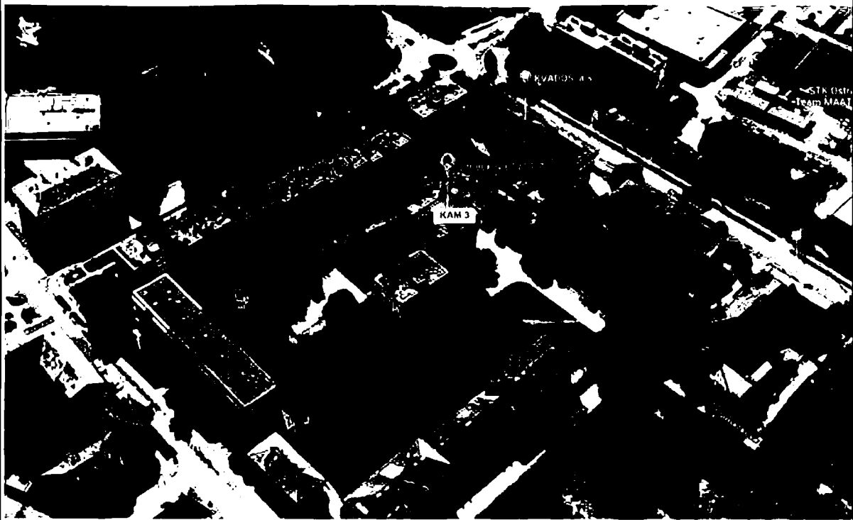
monitorovaná oblast za dodržení přímé viditelnosti