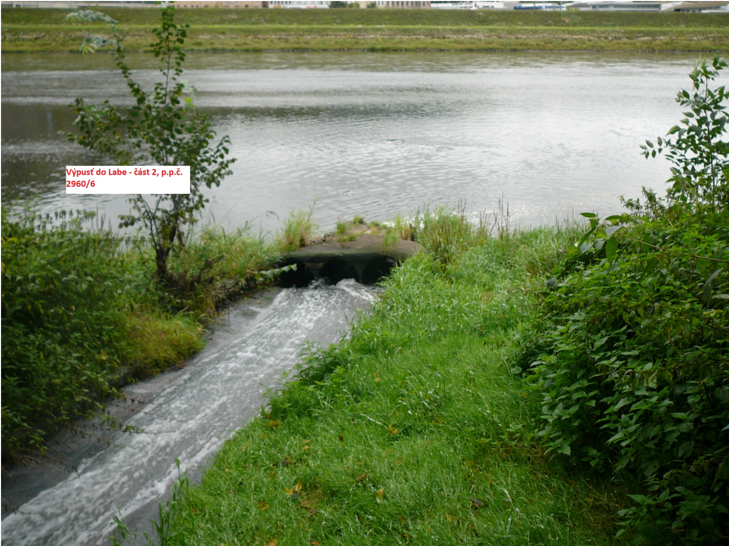
Výpusť do Labe - část 2, p.p.č. 2960/6