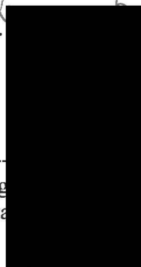
ing. ...vá ředitelka Betanie - křesťanská pomoc, z.ú.