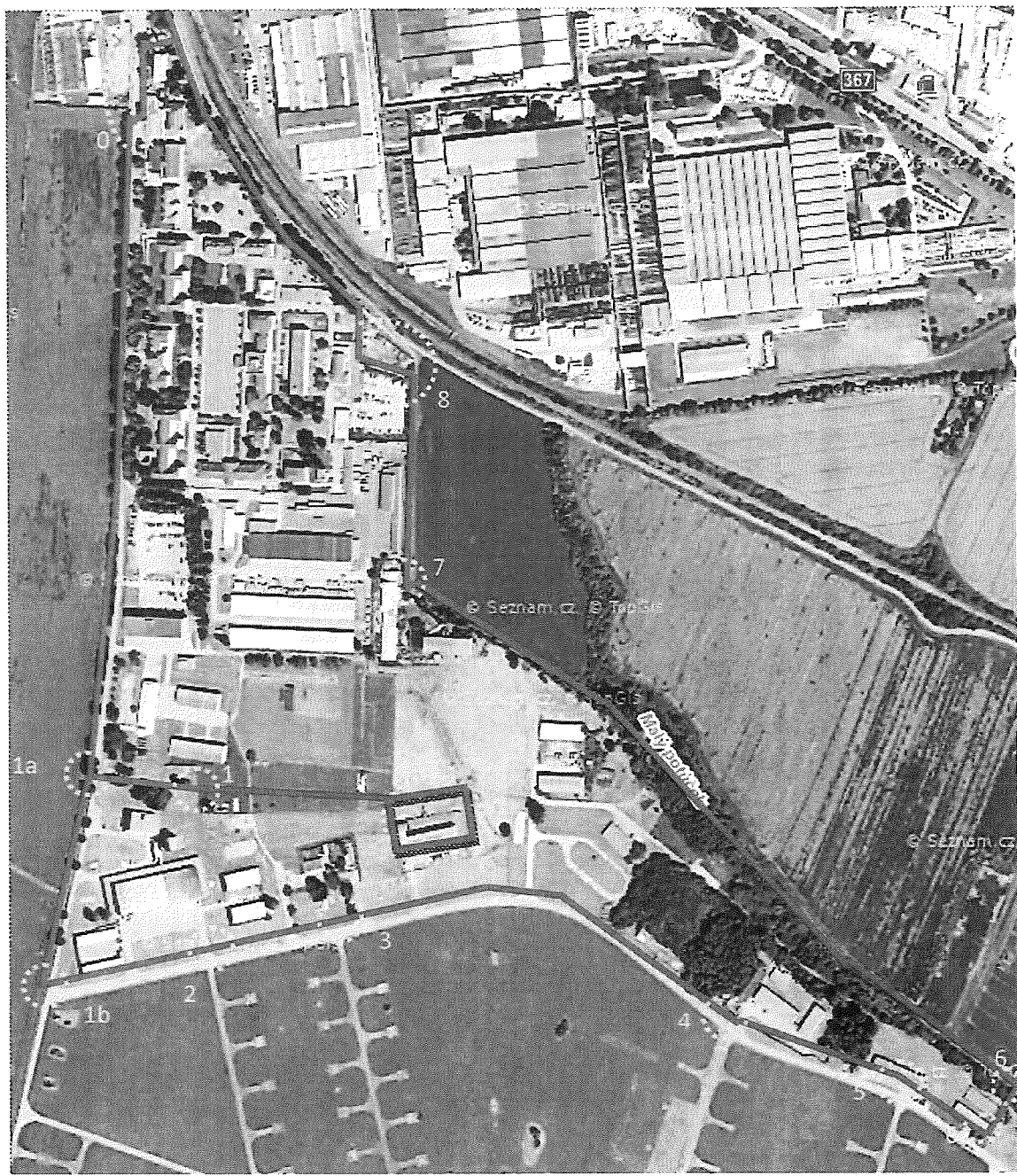
obrázek č. 1 Schéma oplocení areálu