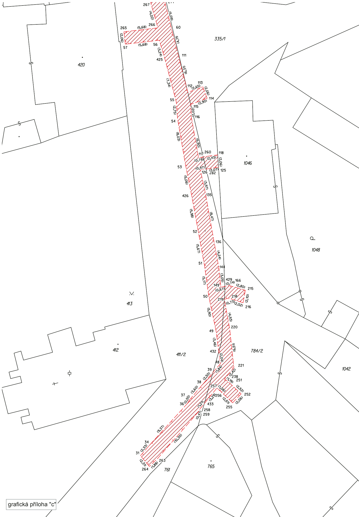
grafická příloha "c"