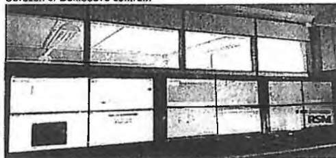
Obrázek 3. Dohledové centrum