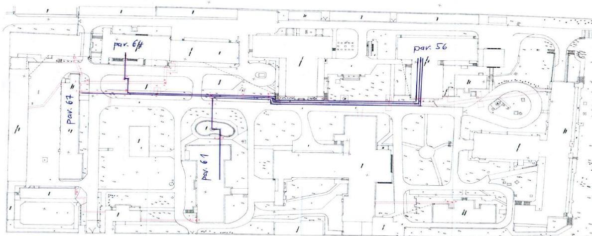
Schéma č. 2 – chráničky pro SIS

Pro SIS bude použita chránička oranžové barvy DN 40 mm z materiálu HDPE s mechanickou odolností 750 N/20 cm a teplotní odolností -5 – 50 °C.