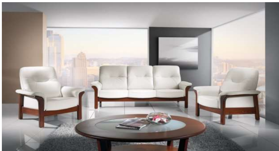
Rozměry a barevné provedení odpovídá zadání