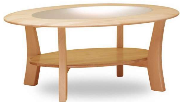
Atypické provedení dle zadání d. 112 cm, šířka 70 cm

Opěrák: rám z překližky a smrku + gumotextilní popruhy + tvarovka z PUR pěny