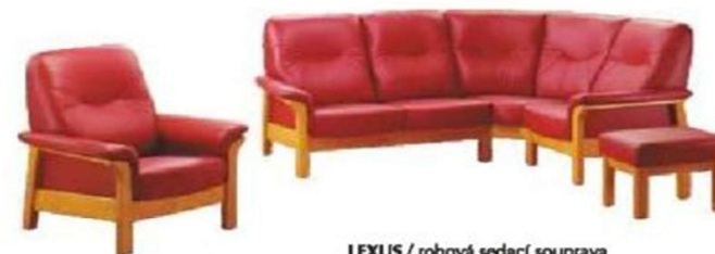
LEXUS / rohová sedací souprava