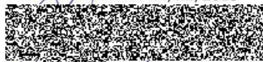
Pilecký natel tovitel)