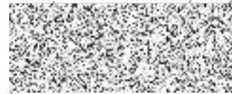
Oprávněný zástupce Středočeského kraje