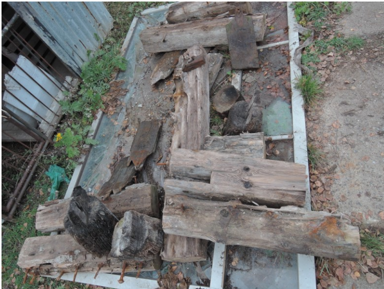
Zbytky původního trámu