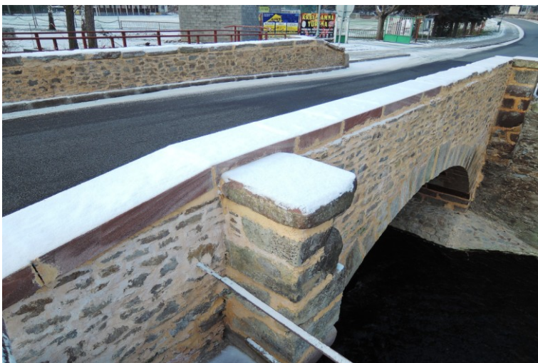
Celkový pohled na most po opravě