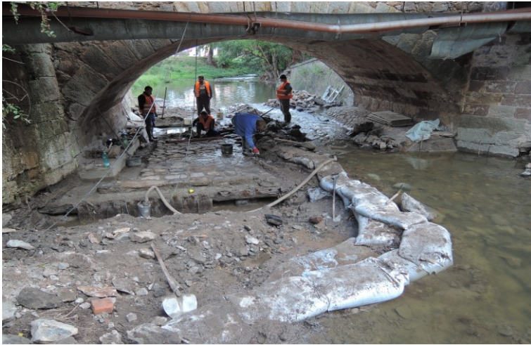
Původní umístění trámu.