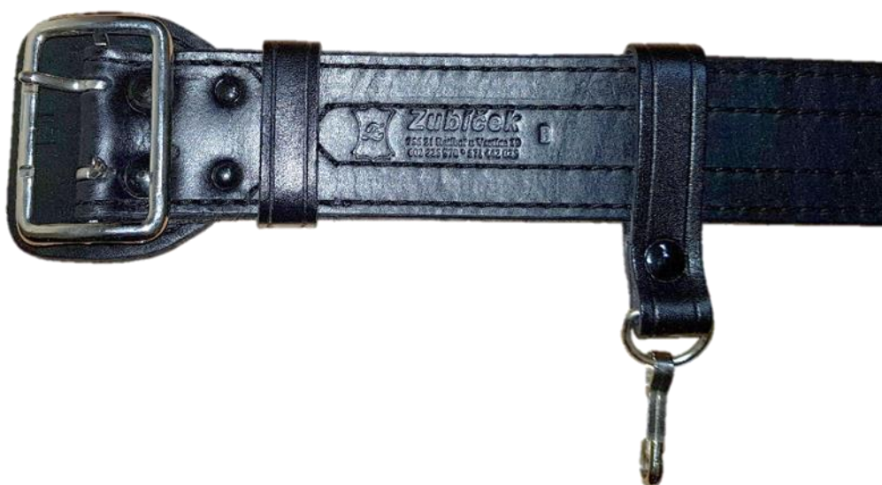
Detail spony, vsuvky, klíčenky a značení pásu