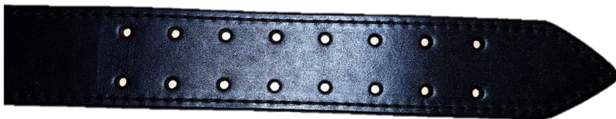
Detail ukončení pásu