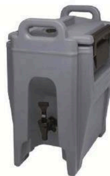
ilustrační obrázek - zásobník na nápoje 40 l