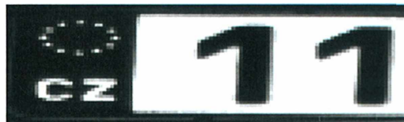
Obrázek 2 - nový stav