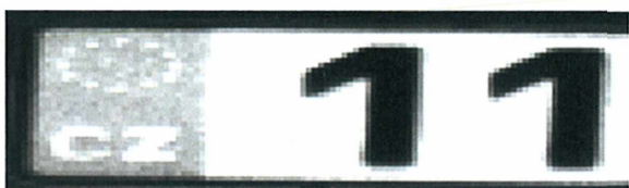
Obrázek 1 - stávající stav

Pro potřeby tunelu v Klimkovicích navrhujeme použití přídatného externího světla, které se umístí v těsné blízkosti detekční kamery. Stále se bude jednat o IR světlo, průjezdný profil nebude ovlivněn. Návrh umístění v nákrese níže.