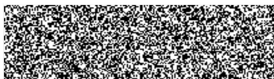
Tomáš Kačírek, na základě plné moci