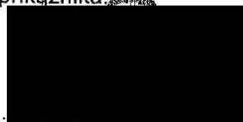
..... Pavel Mitáš na základě plné moci

RTS, a.s. Lazaretní 13 615 00 Brno Brně, B 2671 Č: CZ25533843