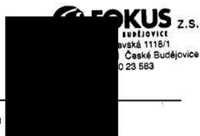
Bc. Zdeňka ředitelka