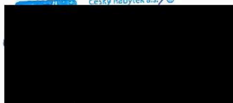
Ondřej Kokeš oprávněný zástupce zhotovitele