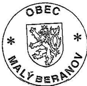
půjčitel Obec Malý Beranov