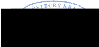
Oldřich Bubeníček, hejtmán Ústeckého kraje