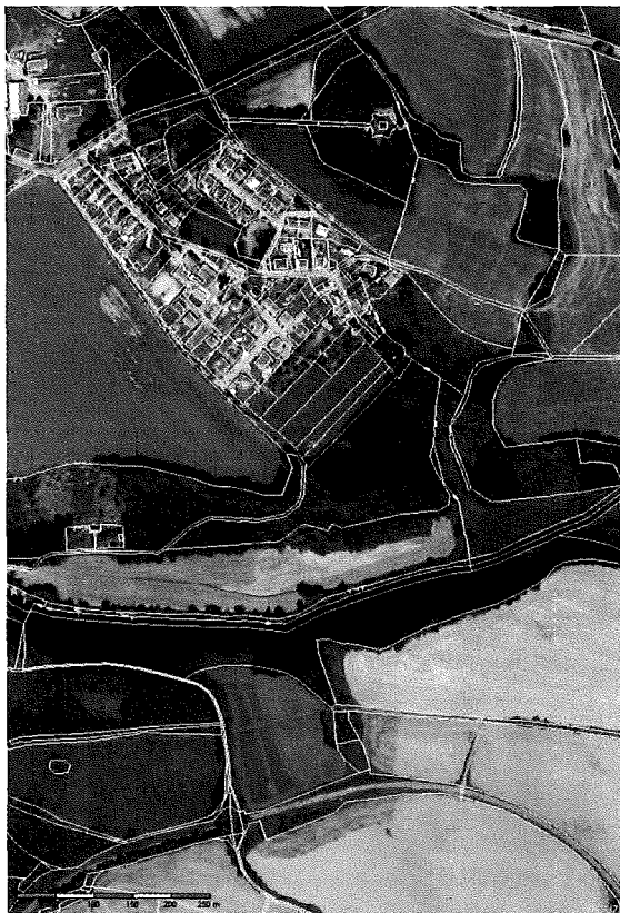
Obec Plandry (okr. Jihlava)

Objednatel: Obec Plandry Plandry 30 588 41 Vyskytná nad Jihlavou