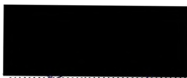
Jindřiška Šindelářová Nájemce