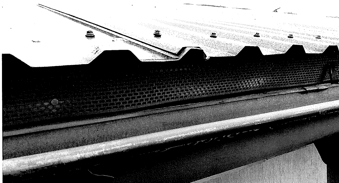
detail okapní hrany u strany do dvora s první latí a ochrannou větrací mřížkou