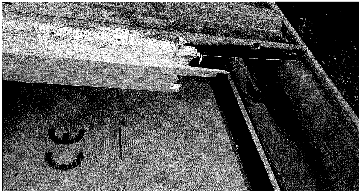
detail okapní hrany u postižené strany bez první latě