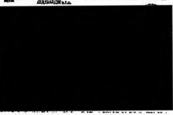
Skořepka 423/9 (Uhelný trh 2)

Střední částí je v. 1.01. 1.02. 1.03. 1.04. 1.05. 1.06. 1.07. 1.08. 1.09. 1.10. 1.11. 1.12. 1.13. 1.14. 1.15. 1.16. VSTUP PROSTOR PRÁCE 11. 12. 13. 14. 15. 16. 17. 18. 19. 20. 21. 22. 23. 24. 25. PROSTOR PRÁCE 11. 12. 13. 14. 15. 16. 17. 18. 19. 20. 21. 22. 23. 24. 25. PROSTOR PRÁCE 11. 12. 13. 14. 15. 16. 17. 18. 19. 20. 21. 22. 23. 24. 25.