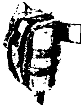
Lékárnička AFAK Paramedik