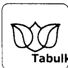
Tabulka č. 1