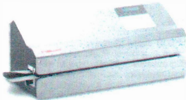
Průběžná svářečka HAWO 850 DC-V

integrovaná tiskárna Zobrazení dat tiskárny na displeji Jednořádkový tisk Automatické nastavení velikosti písma