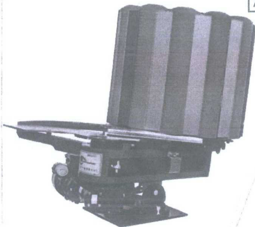
LANCIO CON MOLLA A BALESTRA THROWING SYSTEM WITH LEAF SPRING