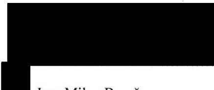
Ing. Milan Bureš

Ve st. restě dne 1. 12. 2017 za prodávající: