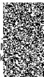
Mgr. Ing. M. M. zek náměstek ředitele ředitelství