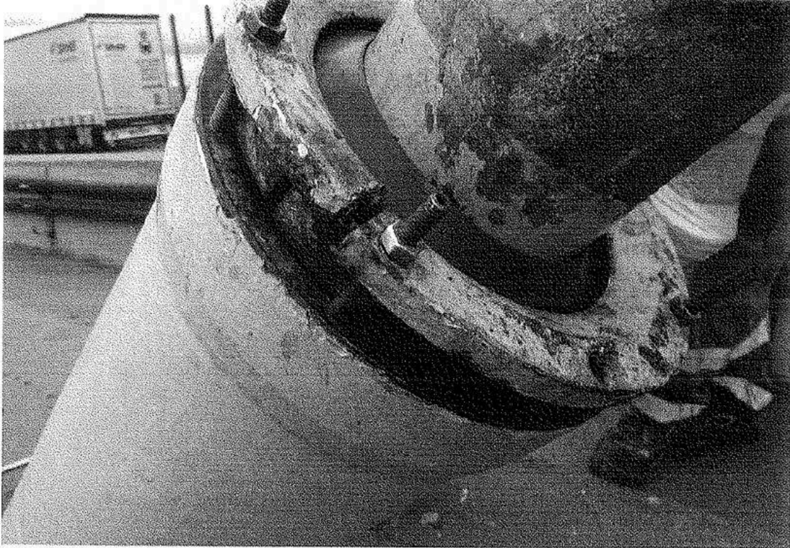
Obr. 1 – Špatný stav stávajících ocelových vik

Změna: S ohledem na změnu rozsahu prací oproti zadávací dokumentaci tímto žádáme investora o prodloužení lhůty výstavby o 10 dní, tj. celkem na 40dní.