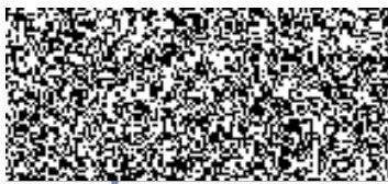
Juraj Ferenc Poskytovatel

Hasičský záchranný sbor Olomouckého kraje