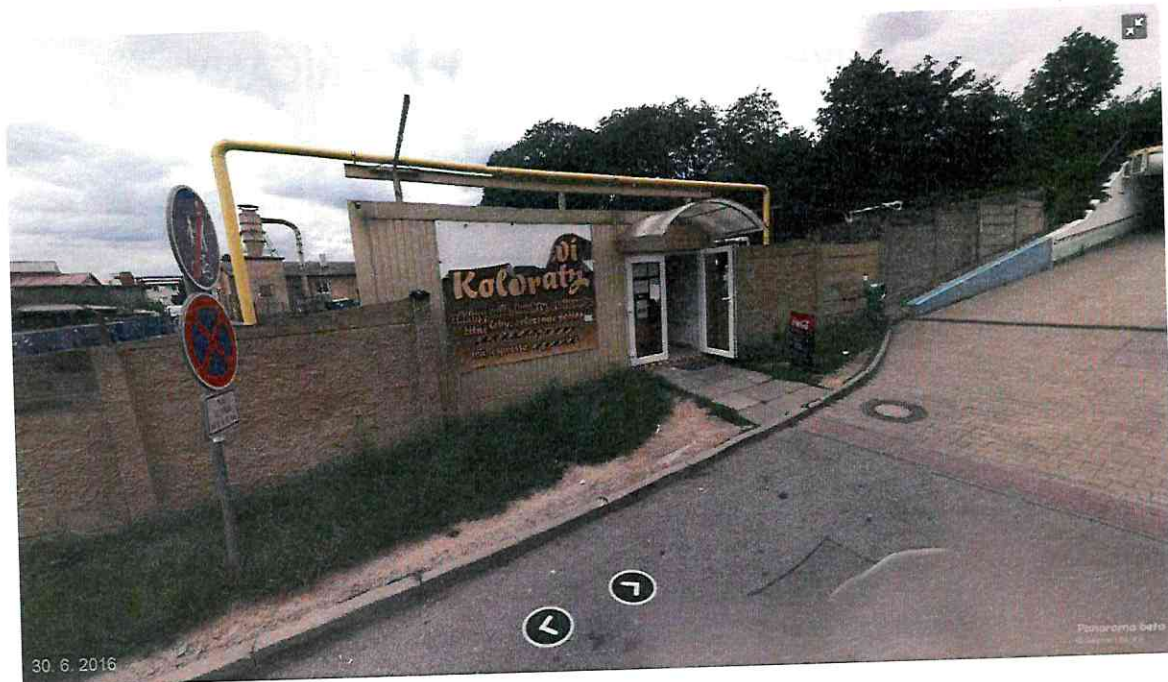
Umístění přístřešku a cykloboxů v ulici Kamenická – pozemek parc.č. 1217/1