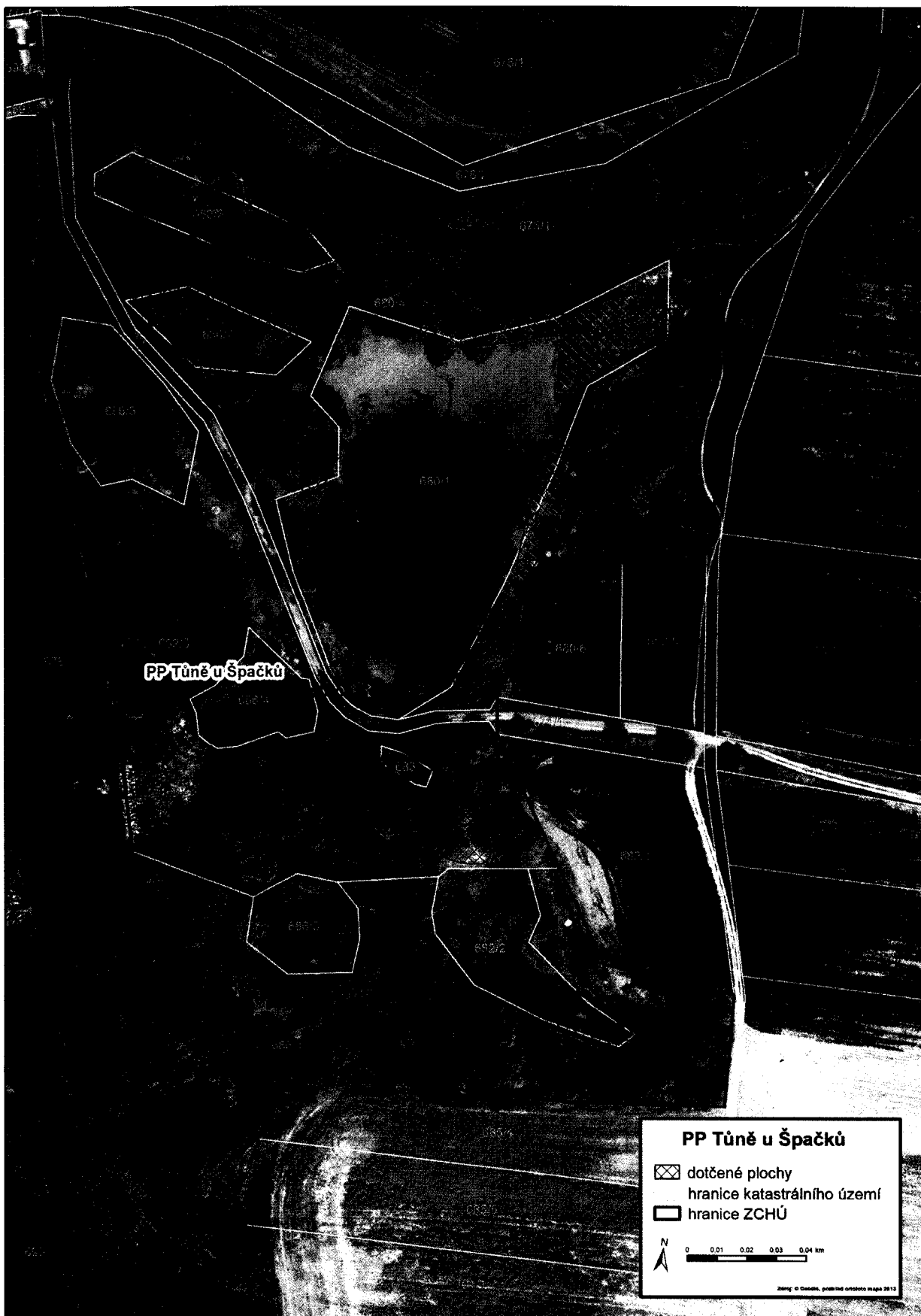
Příloha: ortofoto mapa se zákresem dotčených ploch